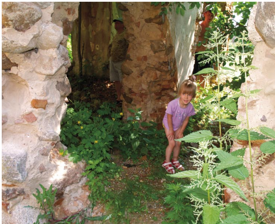
Irstančios, dilgėlėse paskendusios Pavlovo respublikos sienos

plaukikių. Vietiniai sako, kad šis virvinis tiltas skirtas parsinešti itin švaraus šaltinio vandens, srūvančio kitame krante. Ties šia vieta smagu ir papietauti. Svarbiausia šiukšles susirinkti, nes paliktos jos labai bado akis. Nuo čia iki Paupio sodybos dar apie 4 valandos kelio. Mažiau nei pusė tiek, kiek nuplaukėm. Jas visas merkė lietus, kartkartėmis dundulio paskatintas virsdamas į viską plaunančią liūtį. Džiugu, kad lietutis buvo vasariškai šiltas, gerokai karštesnis nei Merkio vandenys, tad po stingdančių maudynių upės vilnyse mums tai buvo tikra atgaiva. Beje, palei upę pakrantėse matėsi sustatytų pavėsinių, kur būtų galima pasislėpti nuo lietaus bei kitų stichijų šėlionių, bet nedelsti mus skatino ir tai, kad pabaigoje laukė garuojanti japoniška pirtis „o-furo“ (karštas kubilas), sauna, šašlykai ir kiti džiaugsmiai, kurie laukinėje gamtoje ypač paaštrėja ir kyla noras kuo greičiau judėti į priekį.