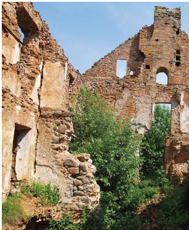
Kadaise gyvavusios valstybės likučiai

žemupyje gali siekti iki trijų metrų. Mūsų kapitonas, patyręs baidarininkas, pasirinko vienvietę baidarę ir tik įlipęs apsisovė, nors šia upe jis plaukia jau kažkelintą kartą. Teko staigiai gelbėti.